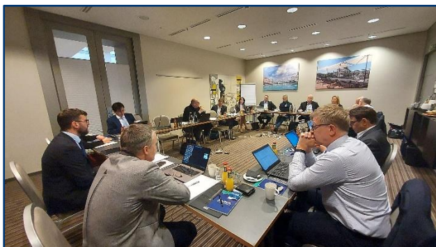
Die Verhandlungskommission der VKA berät die Zwischenergebnisse während der zweiten Verhandlungsrunde.

Im Rahmen der zweiten Verhandlungsrunde wurden zudem Bestandteile einer denkbaren Einigung mit dem Marburger Bund erörtert. Ein wichtiges